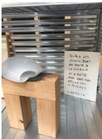
Vue du stand de la galerie Loewenbruck, Paris.