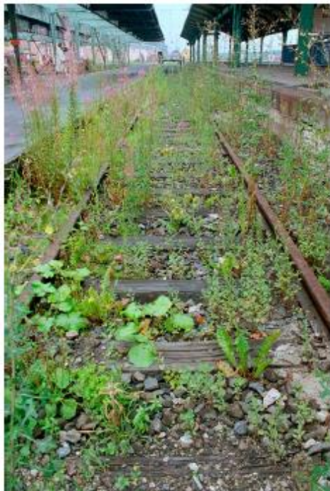
Lois Weinberger, What is Beyond Plants is at One with Them, 1997, Documenta X, Cassel, chemin de fer, plantes néophytes du Sud et du Sud-Est de l'Europe, 100 m.

LES 26 GALERIES ICI RÉUNIES ONT UN POINT COMMUN : ELLES NE SUIVENT PAS LES MODES QUI SE DÉMODENT, LES TOQUADES DU MARCHÉ.