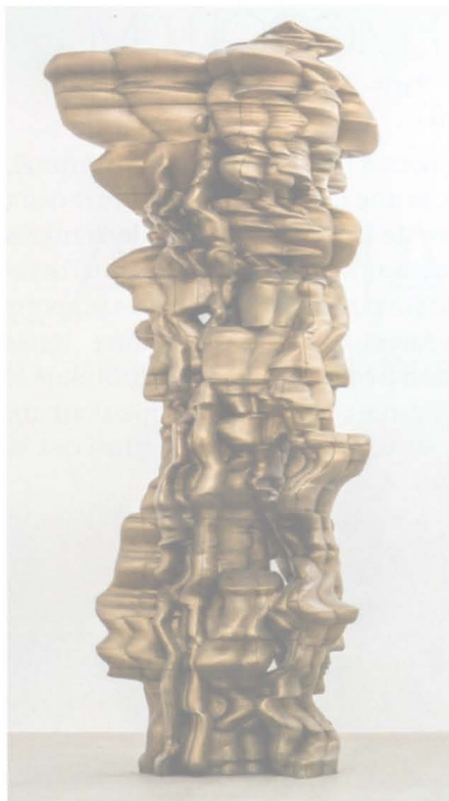
Tony Cragg, Mean Average , 2014, bronze, 570 x 241 x 255 cm.