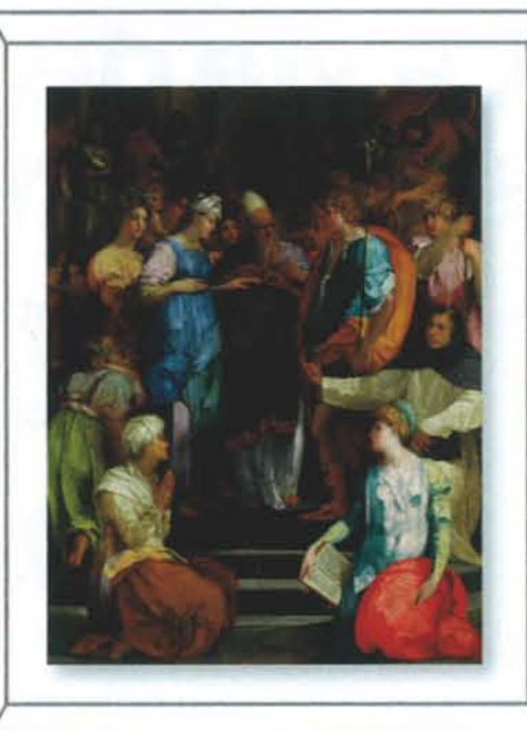
6 « LE MARIAGE DE LA VIERGE » (1523) ROSSO FIORENTINO, AMBASSADE D'ITALIE, PARIS