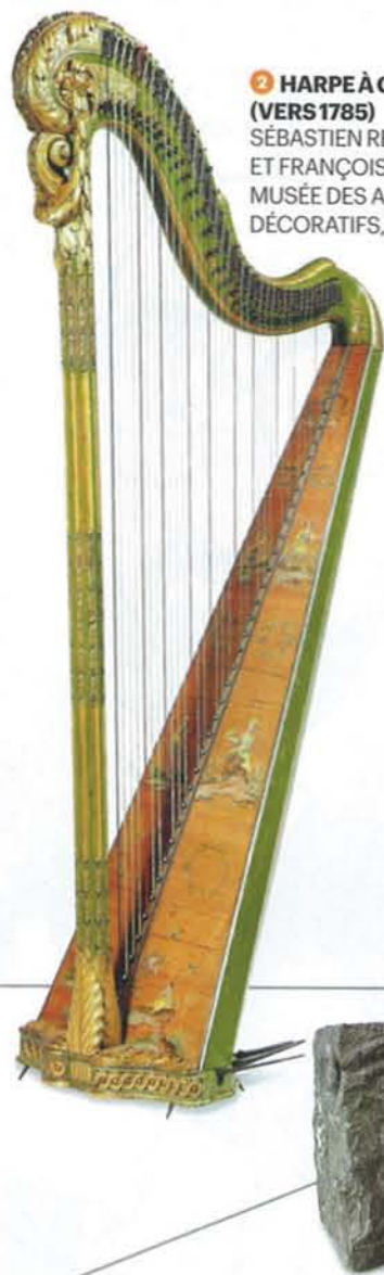
2 HARPE À CROCHETS (VERS 1785) SÉBASTIEN RENAULT ET FRANÇOIS CHATELAIN, MUSÉE DES ARTS DÉCORATIFS, PARIS