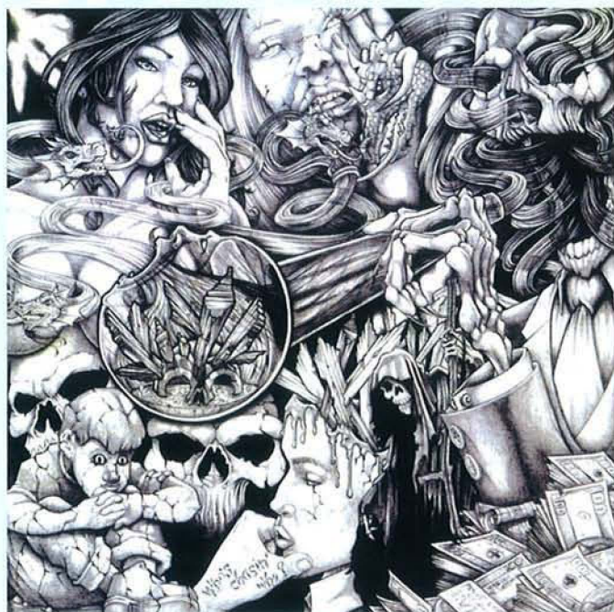
Sans titre, entre 1980 et 2010