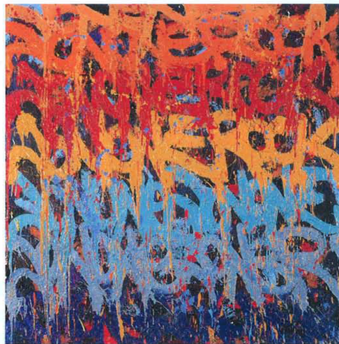
JONONE Flow Like Water , 2014

Tous ces points qui rythment les toiles de Béatrice Casadesus sont pour l'artiste prétexte à jouer sur la lumière grâce à la vibration des couleurs ainsi appliquées et la transparence de la couche picturale. Devenus sa signature, ces motifs sont hérités du maître du pointillisme, Georges Seurat, qu'elle découvre au milieu des années 1970. Bien qu'abstraites, les toiles racontent un moment : Blue Note, Vibration or, Pleine Lune, Suite infinito, Nuit, Heure tranquille... Autant de sujets invitant à la contemplation.