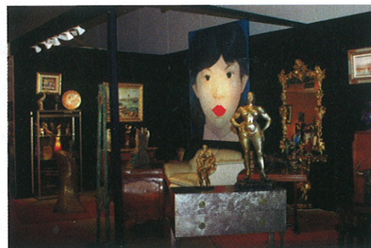
VUE D'ENSEMBLE, SALON DES ANTIQUAIRES ET GALERIES D'ART DE MARSEILLE.