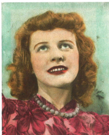
EUGENE VON BRUENCHENHEIN. SANS TITRE. VERS 1970. TIRAGE ARGENTIQUE COLORISE. 23,4 x 21,6 CM.

Pour la première fois depuis vingt ans en Europe sera présentée une exposition monographique de l'Américain Eugene Von Bruenchenhein (1910-1983), au fil d'une trentaine de photographies. L'œuvre de cet autodidacte est abondante, constituée principalement de clichés d'Eveline Kalke, son épouse