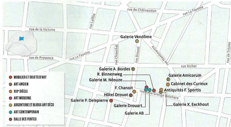
Le quartier de l'Hôtel Drouot (9 e arrondissement)

Les galeries parisiennes se concentrent dans quatre quartiers, qui ont aussi leurs spécialités : les V e et VI e arrondissements, le secteur de l'hôtel Drouot, le Marais et le VIII e arrondissement. Notre sélection. PAR LÉOPOLD SANCHEZ