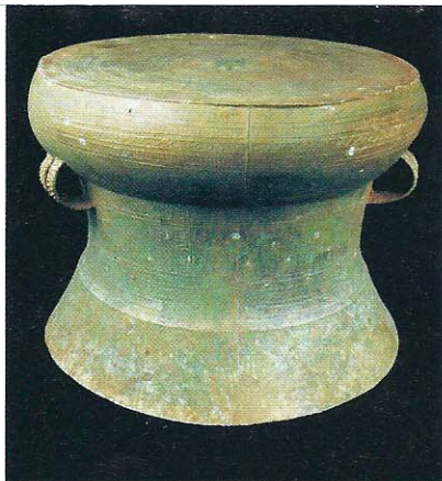
Tambour Đông Sơn Vietnam V e -I er s. av. J.-C.

> « Une rentrée hors les normes Découvertes et nouvelles acquisitions » du 16 septembre au 16 octobre